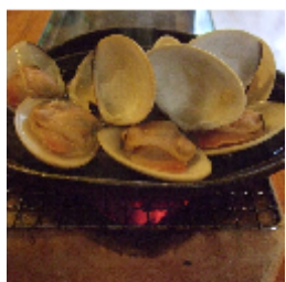
今の時期のおススメ！！

でシコシコと食感もよく、噛めば噛むほど味が出るおいしさでした！またこちらのお店では市場直送の新鮮な鎌倉野菜も取り扱っています。 平成10年には、テレビ番組でお馴染みの「王様のブランチ」や「アド街ック天国」で取材され、王様のブランチの「電話問合わせランキングでは3位になったそうです。お店の方にも和やかに話しかけて頂き、料理だけではなくお店の方との会話でも大満足できるお店です！土日は昼間も営業しています。皆様もご家庭ではなかなか味わうことので