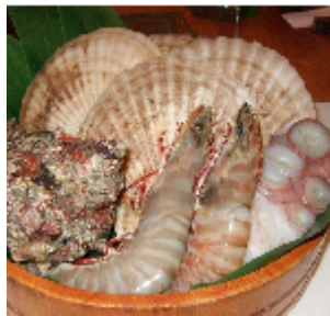
鮮度抜群！の魚介類

今回のグルメレポートでは、いろいろ焼き助一さんへ伺わせて頂きました！今年で29年目を迎えたお店はとも落ち着いていて大人の雰囲気のあるお店でした。お店のこだわりは、お店の名前に